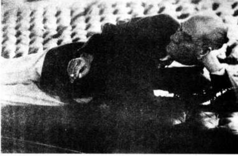
Mustafa Kemal'in 14 Haziran 1938'de Sarayona Yatı'nda çekilen son fotoğrafı.

-Bu gece o kadar çok konuştun ki Kemal, eminim bana söyleyecek tek bir sözün bile kalmadı.